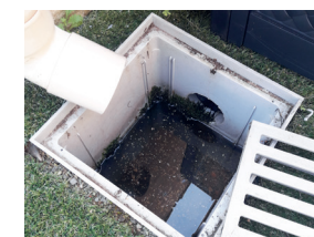
Regards avec bacs de décantation