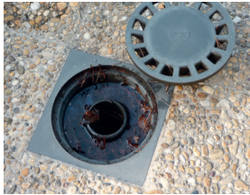
Siphons de sol

Le moustique tigre a un rayon d'action limité de 100 mètres environ autour de son de gîte larvaire. L'élimination des lieux de ponte est donc la méthode la plus efficace contre cet insecte dont 80 % des gîtes se trouvent à l'échelle des jardins. Elle rend inutile le recours à des traitements insecticides chimiques.