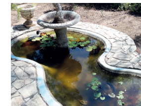
Bassins d'ornement sans poisson