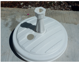
Colonnes et socles de parasol