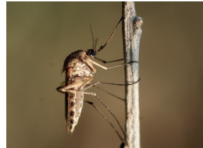
Aedes detritus (rural)

Les adultes, mâles et femelles, se nourrissent du nectar des fleurs et participent ainsi à la pollinisation des plantes, tout comme les abeilles ou les papillons. En revanche, seules les femelles piquent l'Homme ou même, selon les espèces, d'autres animaux, car elles ont besoin de certaines protéines contenues dans le sang pour porter leurs œufs à maturité. Elles pondent chacune jusqu'à 5 fois 200 œufs au cours de leur courte vie (environ 1 mois).