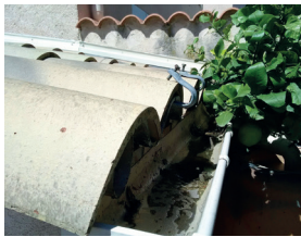
Gouttières bouchées ou en pente inversée