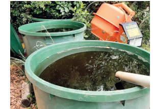
Réserves d'eau non hermétiques