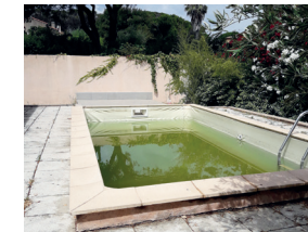
Piscine hors service et bâches de protection