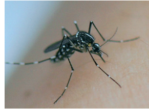
Aedes albopictus/moustique tigre (urbain)