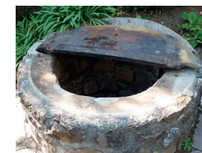
Puits non hermétiques