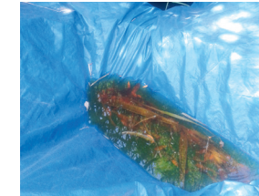
Poches d'eau dans les bâches