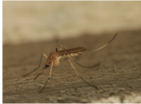
Culex pipiens (urbain)

Le moustique est un insecte qui passe par 4 phases de développement (voir schéma). Dans l'eau, les œufs vont éclore pour donner naissance à des larves dont le mode de vie est exclusivement aquatique. En période estivale, le moustique atteint le stade adulte en une semaine environ. Quelques espèces de moustiques contrôlées par le service LCN.