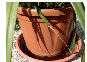
Soucoupes sous les pots