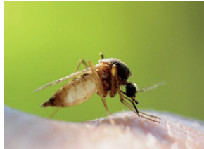
Aedes caspius (rural)