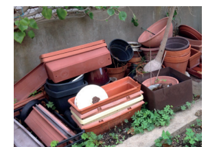
Amoncellements de pots