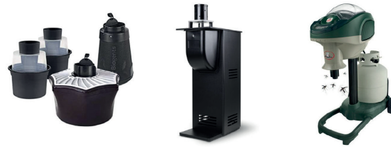
Exemples de pièges à moustiques passifs ou actifs disponibles sur le marché

Il existe de nombreux modèles dans le commerce, les tarifs variant principalement en fonction de leurs rayons d'action. Ils peuvent être passifs ou actifs, avec ou sans aspiration et utilisent des attractifs à base d'imitateurs d'odeurs humaines et/ou de CO2. Leur efficacité dépendra de leur bon positionnement dans le jardin.