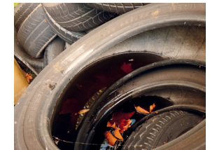
Pneus stockés en extérieur