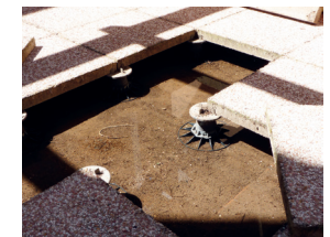
Terrasses sur plots