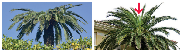
Affaissement de la couronne et absence de palmes centrales