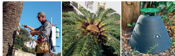
Injection d'un palmier