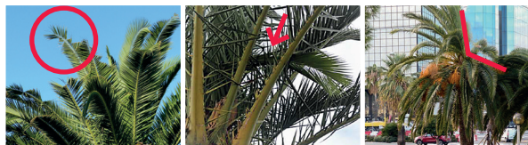
Encoches sur palmes Palmes cassées ou coupées Asymétrie du cœur