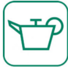
HUILES DE VIDANGE

Les huiles de vidange usagées sont les huiles minérales et synthétiques, lubrifiantes ou industrielles qui sont devenues impropres à l'usage auquel elles étaient destinées (huiles de moteur à combustion, huiles lubrifiantes, etc.). En raison des risques pour la santé et l'environnement, elles doivent être apportées en déchèterie pour leur prise en charge dans la filière réglementaire.