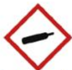
Gaz sous pression