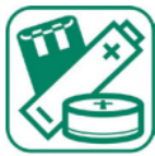
PILES ET ACCUMULATEURS

Les piles (piles bâtons, plates ou boutons alcalines ou salines) et batteries portables (batteries d'outillage, d'appareil photo, de téléphones, de PC, etc.) sont des déchets contenant des substances chimiques présentant des risques pour l'environnement, qui ne doivent pas être mélangés dans les déchets courants. Un tri et un traitement adéquats permettent de les recycler et d'éviter toute pollution.