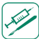
DÉCHETS D'ACTIVITÉS DE SOINS À RISQUES

Les déchets d'Activités de Soins à Risques Infectieux (DASRI) piquants ou coupants doivent faire l'objet d'une attention particulière en raison des risques qu'ils représentent pour votre santé (blessures, infections) ou celle de votre entourage et des accidents qu'ils peuvent occasionner au cours de leur gestion (collecte, usine de traitement, centre de tri, etc.).