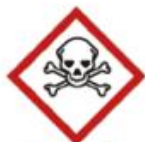
Danger de toxicité aiguë