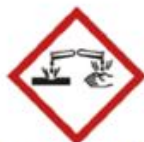
Danger de corrosion