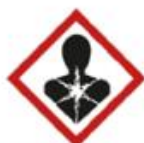
Dangers graves pour la santé