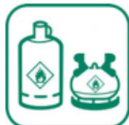
BOUTEILLES DE GAZ

Les bouteilles de gaz rechargeables destinées à un usage individuel regroupent tout récipient sous pression contenant des gaz liquéfiés, comprimés ou dissous, pouvant être rechargé, d'une capacité unitaire en eau ne dépassant pas 150 litres. Elles doivent être rapportées sur l'un des points de vente de la marque pour qu'elles soient stockées, transportées et réutilisées dans des conditions optimales de sécurité, en contribuant à la protection de l'environnement. Les bouteilles de gaz de pétrole liquéfiés (GPL) seront reprises sans frais, sur présentation ou non du bulletin de consignation.