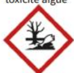
Dangers pour l'environnement

Consignes à respecter : les déchets doivent être déposés en déchèteries et remis directement à l'agent de déchèterie. Les déchets doivent être identifiables, fermés et conditionnés dans leur emballage d'origine.