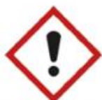
Dangers pour la santé