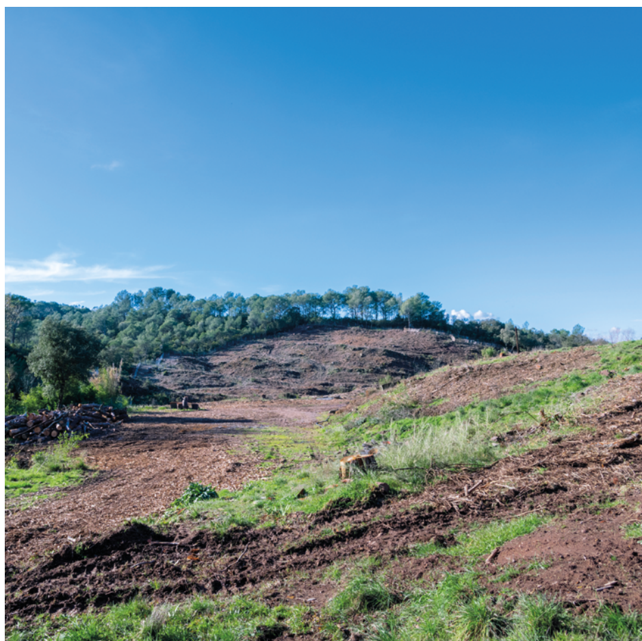
Site de construction du futur écrêteur de crue de l'Aspé au sud du lieu-dit de Montrouge, sur le cours d'eau du Vallon des Crottes

Ces travaux vont être menés par Estérel Côte d'Azur Agglomération, dans le cadre de sa compétence Gestion des Milieux Aquatiques et Prévention des Inondations (GEMAPI). Cet aménagement se situera au sud du lieu-dit de Montrouge, sur le cours d'eau du Vallon des Crottes. Son objectif est de réduire les débits d'entrée dans la Garonne en écrétant cet affluent. Il sera constitué d'une digue en remblais de 190 m de long, de 70 m de large et de 15,5 m de hauteur. Sa capacité de rétention sera de 186 000 m 3 . Par autorisation préfectorale, la Communauté d'agglomération a déjà procédé aux premiers travaux environnementaux, au second semestre 2022, avec le sauvetage d'espèces protégées et le défrichage du site.