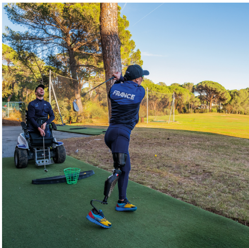
Initiation à l'handigolf pour l'équipe de France paralympique de triathlon