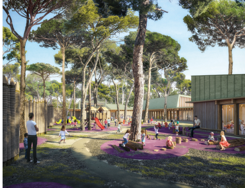
Image de synthèse du futur Centre de loisirs de Valescure

des places de stationnement et un trottoir conforme aux normes Personne à Mobilité Réduite. Le coût des travaux est estimé à près de 3,8 millions d'euros, subventionné à 23 % par le Conseil Départemental, à 9 % par la Caisse d'Allocations Familiales et à 6 % par le Conseil Régional. La fin des travaux du centre est prévue en novembre 2023.