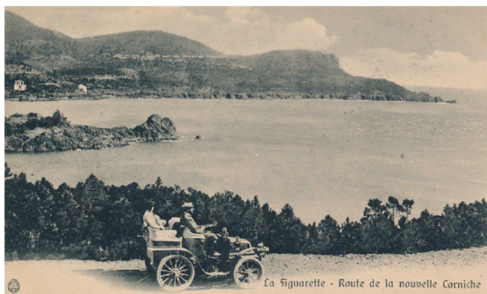
Automobile au Trayas au début du XX e siècle. Au fond, la pointe de l'Esquillon.

Conscient du grand potentiel touristique du massif de l'Estérel, le Touring-Club de France imagine en 1897 un projet de voie d'un mètre de large qui desservirait à différents points le site. Projet retoqué par le maire d'alors, Léon Basso, qui anticipe qu'une fois livré à la circulation, le sentier sera fréquenté par tous les touristes « épris de belle nature ». Le premier magistrat demande aux Ponts et Chaussées qu'une route de 5 mètres de large minimum soit réalisée. Alors que la Ville entreprend en 1898 le réaménagement du chemin vicinal 7, de Saint-Raphaël à Agay, le Touring-Club de France (TCR) prend le relais concernant le tronçon allant d'Agay à Mandelieu, sur 27 kilomètres. Le dynamique président du TCR, Abel Ballif, se charge de coordonner